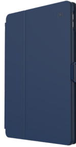
Coastal Blue/ Charcoal Grey