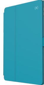
Bali Blue/ Skyline Blue